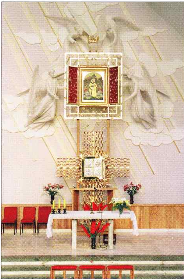
Ółtarz główny w Sanktuarium Matki Bożej Pocieszenia w Pasierbcu