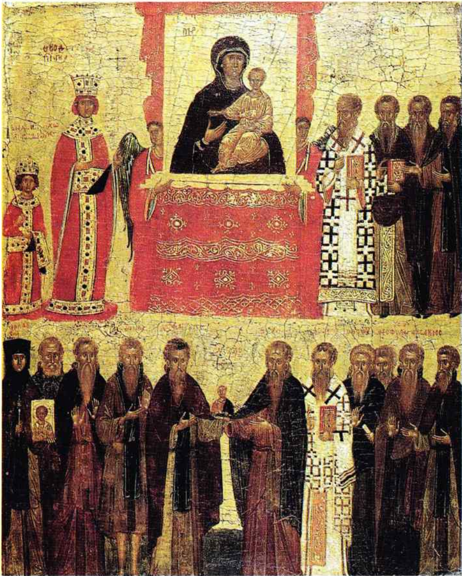
il. 8. Ikona Triumfu Ortodoksji (fragment), deska, tempera, 39 × 31 cm, ok. 1400, Konstantynopol, British Museum, Londyn; rep. za: R. Cormack, Icons , The British Museum Press 2007, s. 6