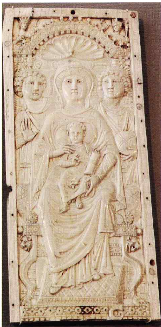
il. 3. Ikona Matki Bożej „Tronującej” (skrzydło dyptyku), kość słoniowa, 29,5 × 13 cm, VI w., Konstantynopol, The Museum of Byzantine Art, Berlin, fot. K. Stawecki