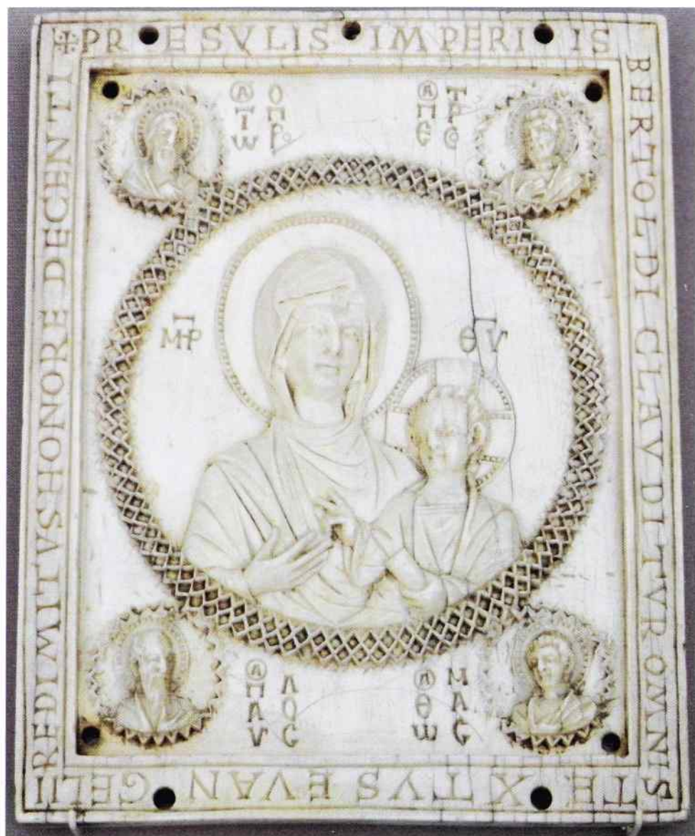
il. 7. Ikona Matki Bożej Hodegetrii (część tryptyku), kość słoniowa, 14 × 11 cm, X/XI w., Konstantynopol, The Museum of Byzantine Art, Berlin, fot. K. Stawecki