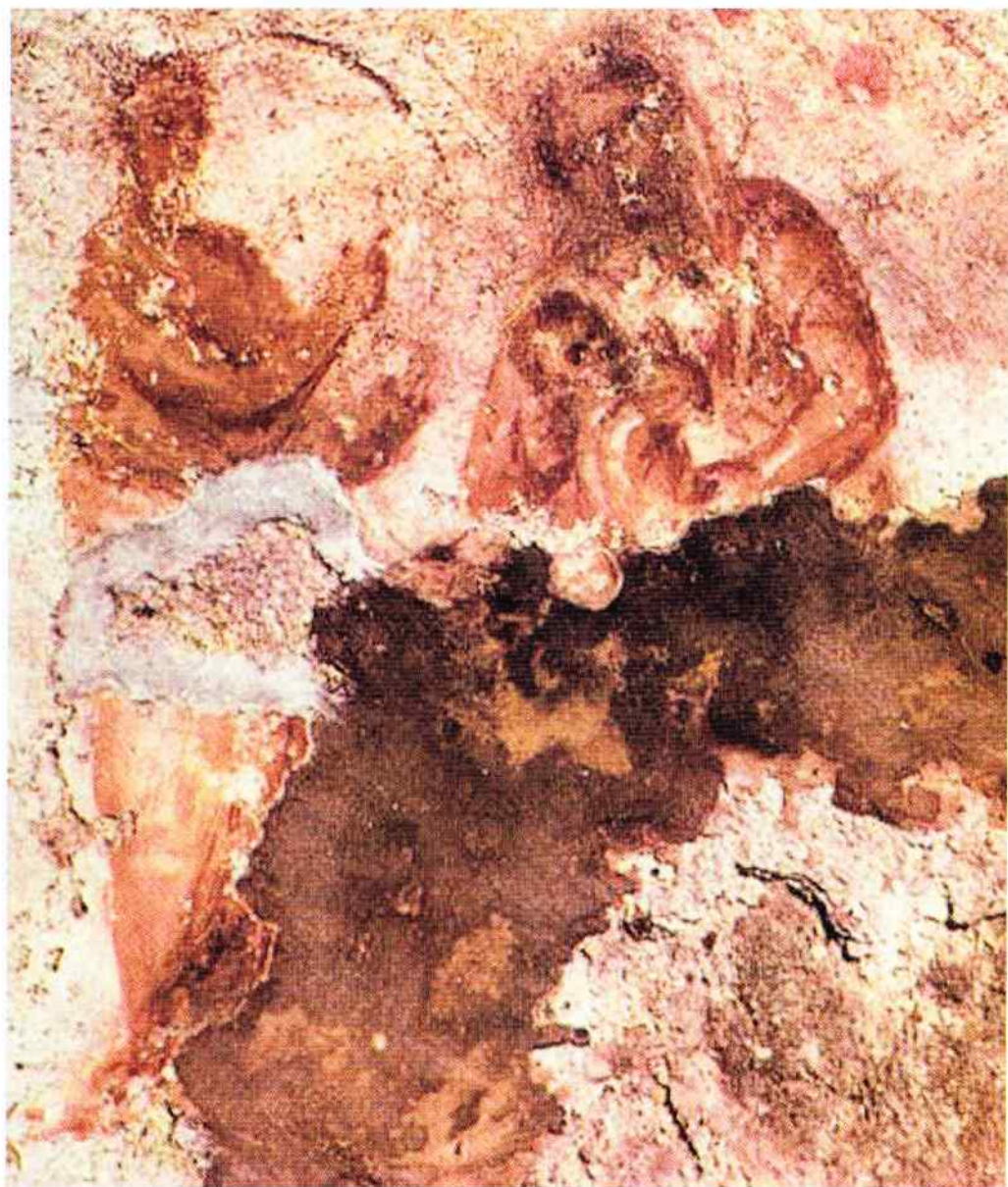
il. 1. Matka Boża z Dzieciątkiem i prorokiem (?) – fragment malowidła z katakumb Priscilli, pomieszczenie nr 10,2, 1. poł. III w. (?) Rzym; rep. za: V.F. Nicolai, F. Bisconti, D. Mazzoleni, The christian catacombs of Rome. History, Decoration, Inscriptions , eng. transl. by C. C. Stella, L. A. Touchette, Regensburg 2002, s. 125