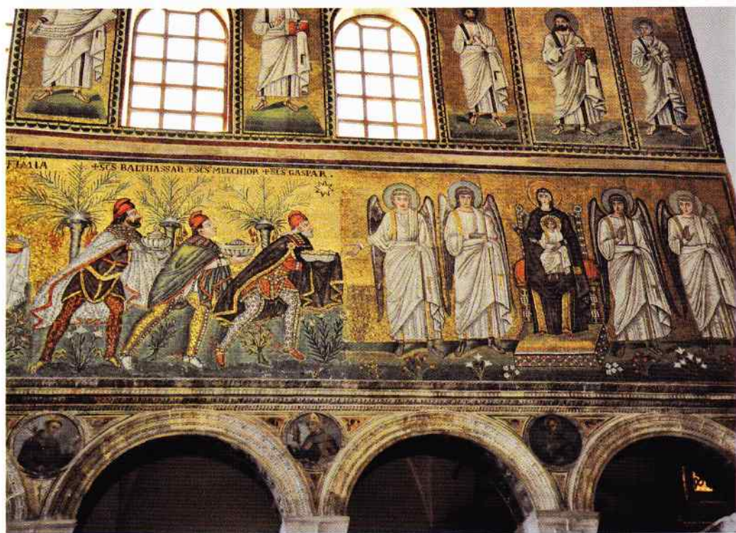
il. 2. Scena pokłonu Magów z ujęciem Bogarodzicy „Tronującej”, mozaika z San Apollinare Nuovo, VI w., fot. K. Stawecki