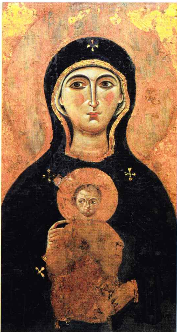
il. 5. Ikona Matki Bożej „Nikopoi” (fragment), XI w., Konstantynopol, bazylika św. Marka w Wenecji; rep. za: St. Mark's. The Art. And Architecture of Church and State In Venice , ed. by E. Vio, Venice 2011, s. 283