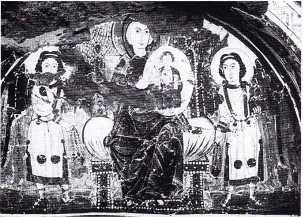
il. 4. Wizerunek Matki Bożej z Emmanuelem ukazanym w sferze (fragment), fresk z monasteru św. Apollona w Bawit, kaplica XXVIII, VI-VII w., Egipt; rep. za: http://ica.princeton.edu