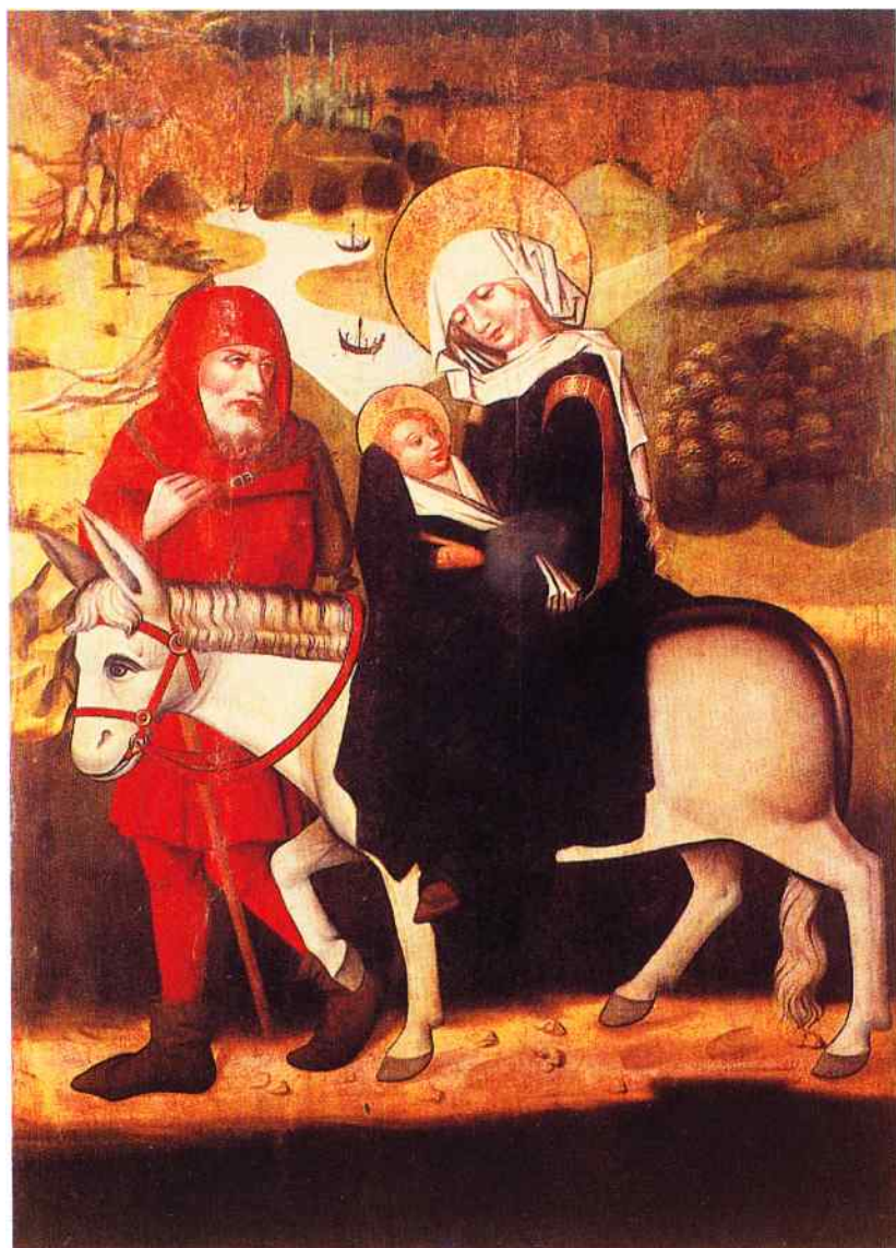
Mistrz Pasji Dominikańskiej, Ucieczka do Egiptu , ok. 1465, kwatery ołtarza głównego z kościoła OO. Dominikanów w Krakowie, Muzeum Narodowe w Krakowie