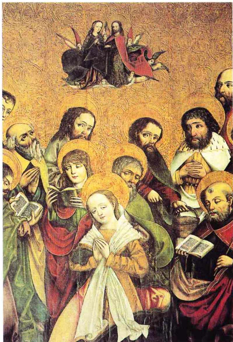
Zaśnięcie Najświętszej Maryi Panny, pocz. XVI w., kościół św. Jakuba Apostoła w Piotrkowie Trybunalskim