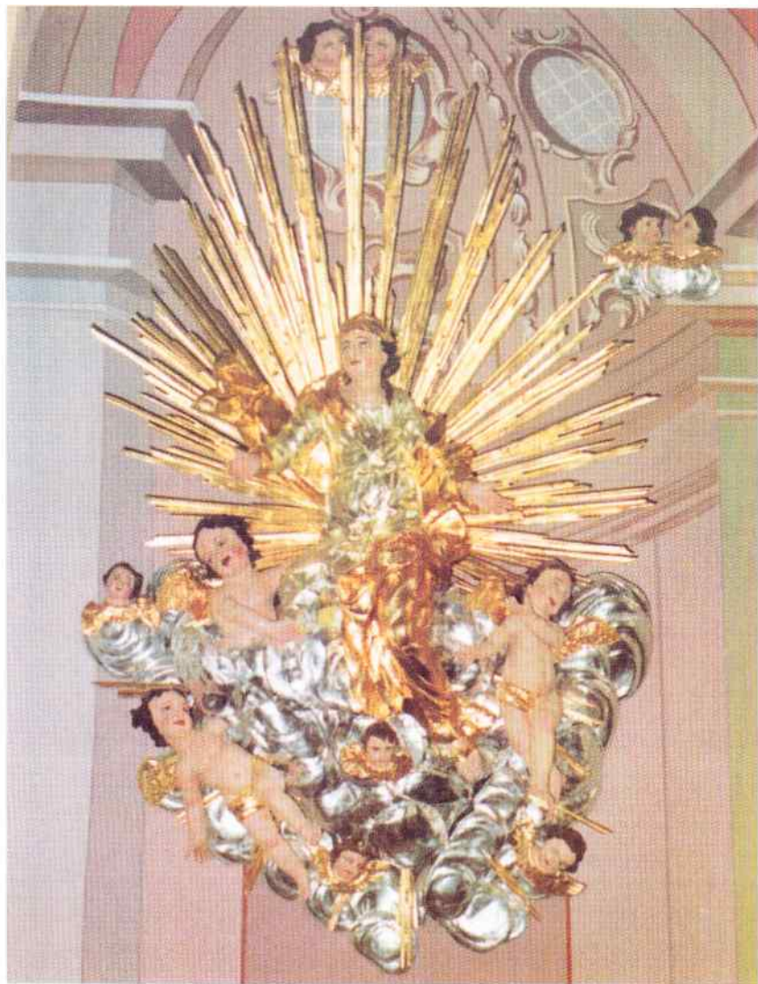
Wniebowzięcie Najświętszej Maryi Panny, figura z ołtarza głównego kościoła OO. Bernardynów w Warcie