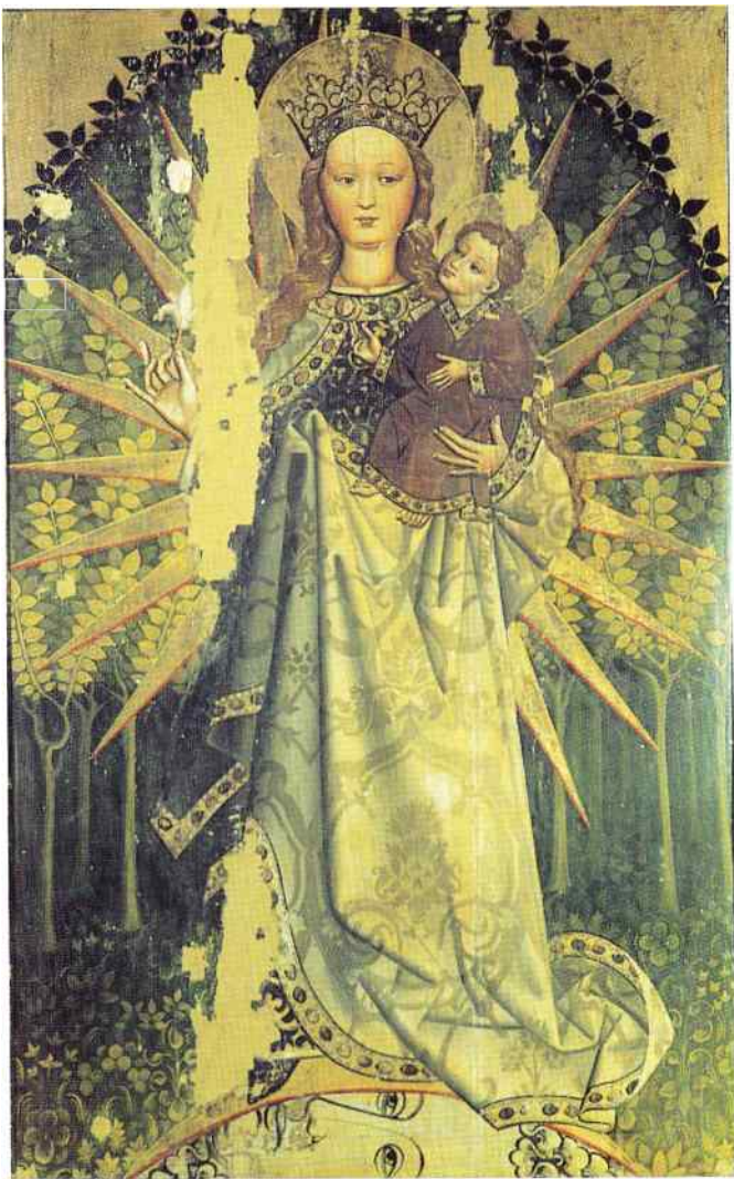
Apokaliptyczna Matka Boska z Dzieciątkiem („Obleczona w słońce”), ok. 1450, środkowa część tryptyku z kościoła parafialnego w Przydonicy