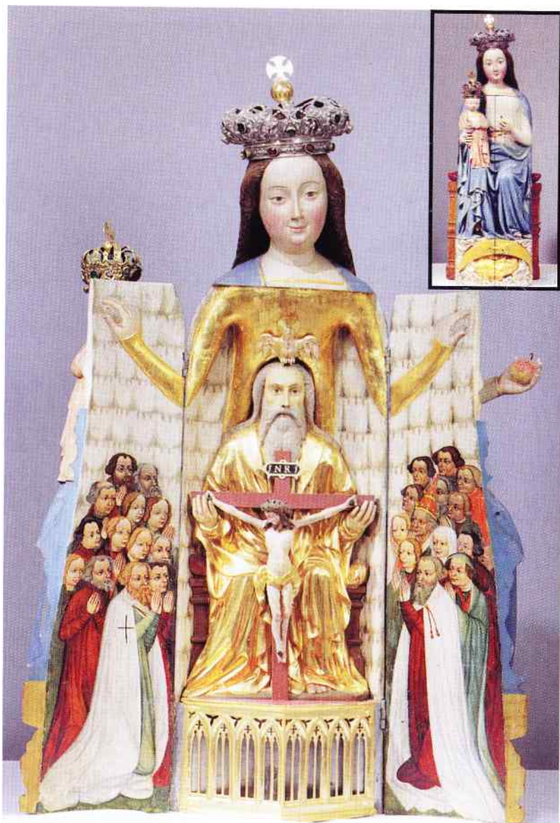
Madonna sejneńska, XV w., kościół Nawiedzenia Najświętszej Maryi Panny w Sejnach