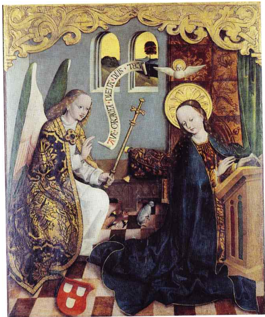
Zwiastowanie, malarz wrocławski, XV w., Muzeum Narodowe w Warszawie